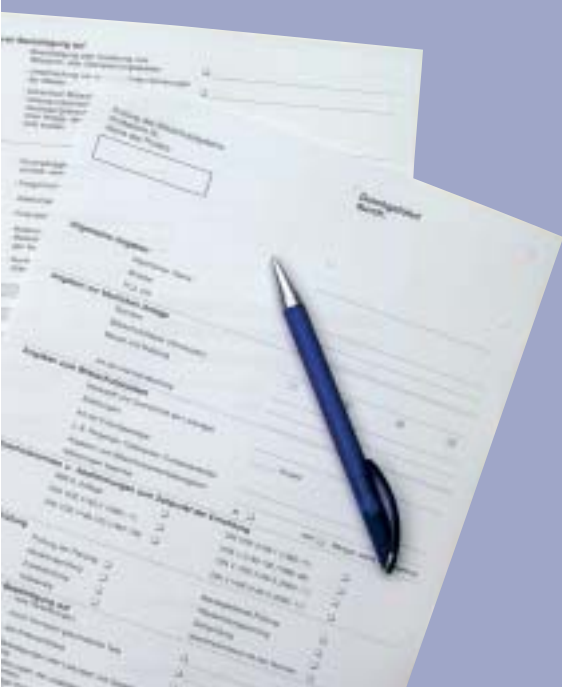
Интервалы между перепроверками