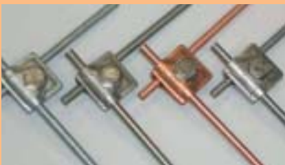
Материалы: Пример Круглый провод 8мм и соединитель быстрого монтажа Vario тип 249 из стали (FT), стали (VA), меди и алюминия

В сфере внешней молниезащиты используются преимущественно следующие материалы: оцинкованная сталь, нержавеющая сталь (VA), медь, алюминий.