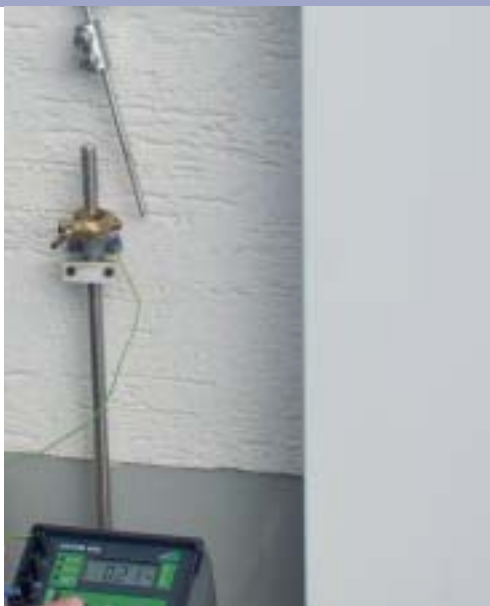
Измерение сопротивления заземления