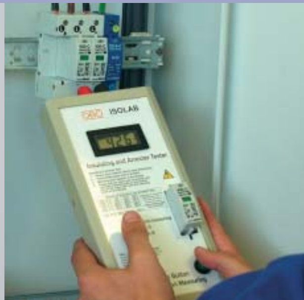
Измерение разрядников защиты от перенапряжения