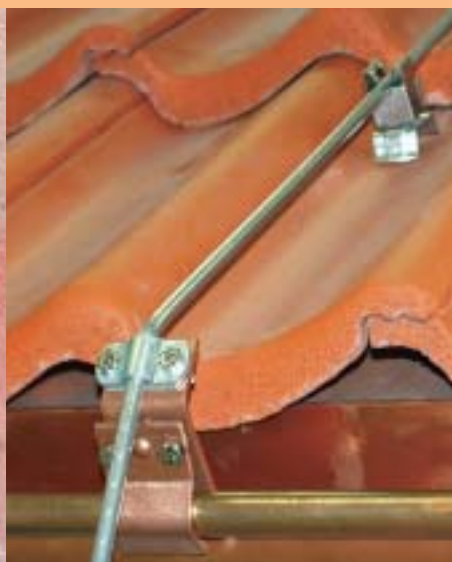
Правильный монтаж с биметаллическим соединителем (алюминий/медь)

лей на медном водосточном желобе, к которому подсоединен алюминиевый круглый провод. Для мест с повышенным риском образования коррозии, например, мест ввода в бетон или землю, должна использоваться защита от коррозии. На места соединений в земле в качестве защиты от коррозии следует нанести соответствующее покрытие. Алюминий не должен прокладываться непосредственно (без зазоров) по штукатурке, строительному раствору или бетону, внутри них или под ними, а также в земле. Возможные последствия изображены на примере справа. В таблице “Комбинации материалов” приведена оценка возможных комбинаций металлов с точки зрения контактной коррозии в воздухе.