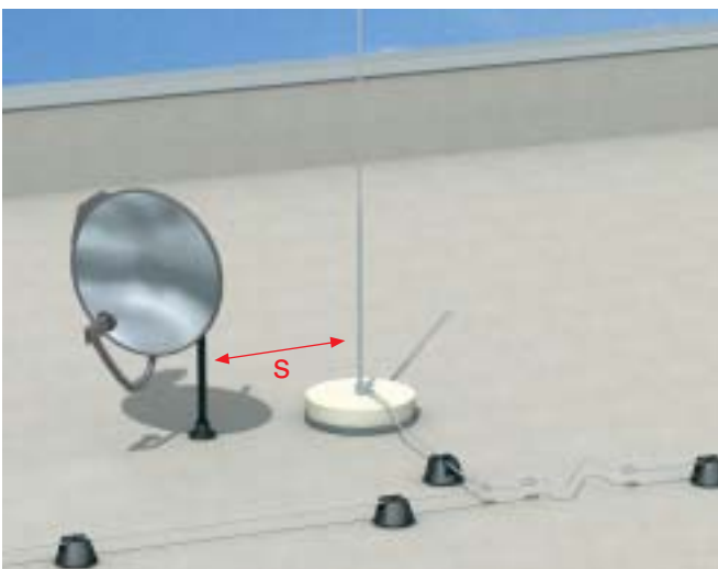
Корректно выдержанный разделительный промежуток s между молниеприемным оборудованием и спутниковой системой